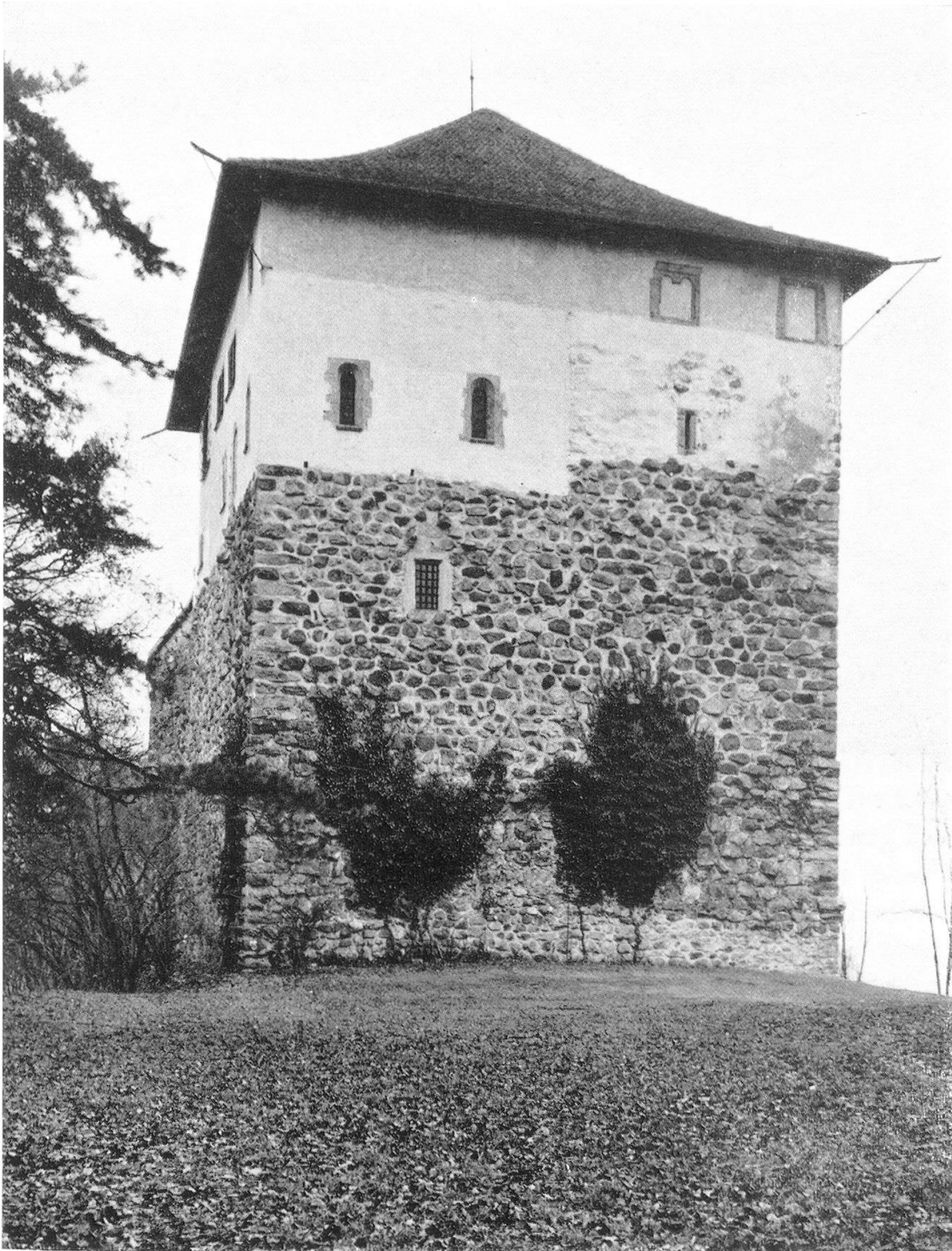
Mörzburg bei Winterthur Stammsitz der Herren von Winterthur; um 1120 von Adalbert von Mörzburg durch Um- mantelung der älteren Anlage verstärkt