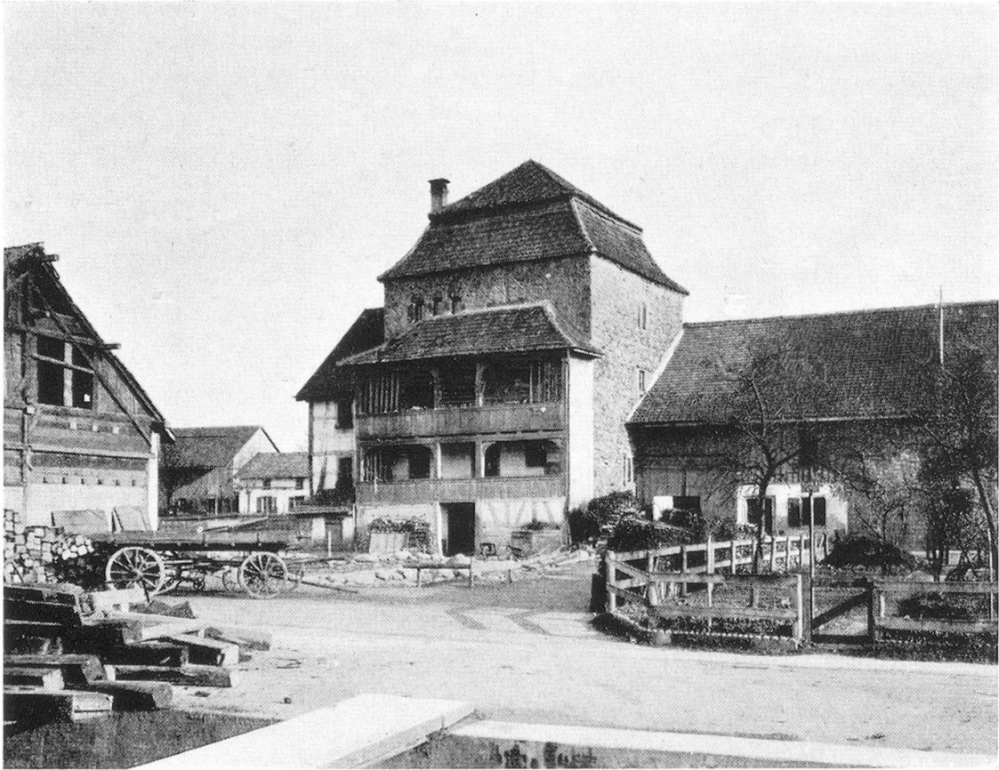
Burg Wiesendangen Erbaut von Berchtold von Märsstetten-Wiesendangen um 1120