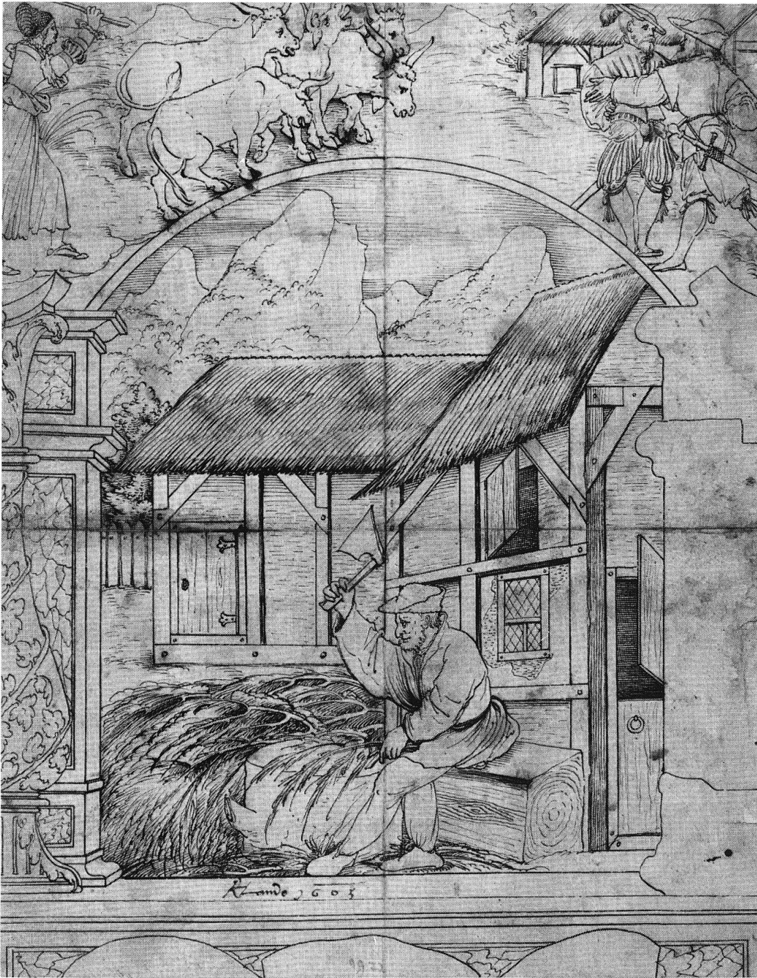
Abb. 10: Schneitelwirtschaft, zweite Hälfte des 16. Jahrhunderts: Besonders im Frühjahr, wenn der Heuvorrat aufgebraucht und das Gras noch nicht ausgetrieben war, mussten die Bauern in ihrer Not dem ausgehungerten Vieh die feineren Zweigbündel von Tannen und Fichten verfüttern. Die gröberen Äste dienen als Heizmaterial oder zum Füllen undichter Wände. Oder hackte der Bauer mit seiner Axt diese Äste zur Gewinnung von Streu in den Winterstall? — Scheibenriss eines anonymen Meisters, Schweizerisches Landesmuseum Zürich, LM 25 621.