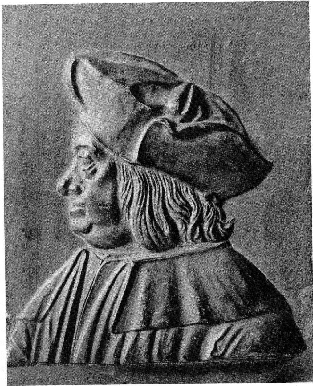
Abb. 1 Bronzeplakette mit Bildnis des Gian Giacomo Trivulzio il Magno. Schweiz. Landesmuseum. Inv. LM 25117. Höhe 19,5 cm, Breite 15,6 cm.