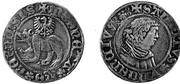
Dicken der Stadt Bern von etwa 1482. Heiliger Vincencius, nach rechts blickend.

Als die Stadt Bern errichtet wurde, gehörte auch der Bau einer Leutkirche zu dem grossen Unternehmen. Das Aufblühen der Zähringerstadt veranlasste später zu zweien Malen Neubauten. Das heutige Münster wurde 1420 begonnen. Diese Hauptkirche der Stadt stand unter dem Patrozinium des heiligen Vincencius von Saragossa , eines namentlich in Spanien, Frankreich und Westdeutschland hochverehrten Märtyrers. Der spanische Titelheilige tritt schon in der chronikalischen Überlieferung als eine Art Schirmherr von Bern auf, formuliert doch Konrad Justinger bei der Schilderung der Gründung Berns folgendermassen: