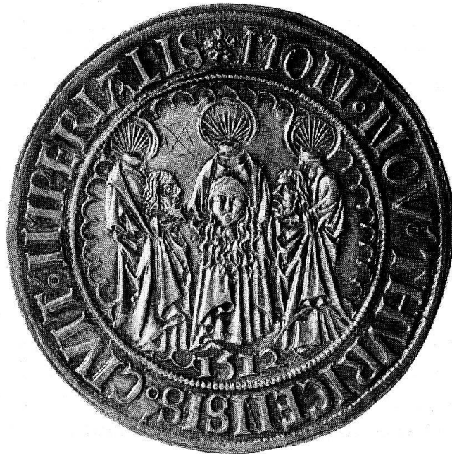
Taler der Stadt Zürich von 1512 (vergrössert).

In der Chronik der Stadt Zürich vom Anfang des 15. Jahrhunderts wird in den ersten Kapiteln neben der fabulösen Gründungsgeschichte das Martyrium der Stadtheiligen ausführlich behandelt. Hier wird nun aber auch die Bedeutung Karls des Grossen für Zürich unterstrichen, der als Gründer des Grossmünsters und seiner Schule galt und der von seiten der Propstei und der Stadtgemeinde, wohl in bewusstem Gegensatz zum Fraumünster, dessen Äbtissin ja seit dem