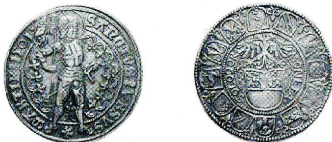
Taler der Stadt Solothurn ohne Jahreszahl, um 1500 (verkleinert). Stehender gewappneter heiliger Ursus.

Die beiden Städte Freiburg und Solothurn, die sich je ein respektables Territorium zu schaffen gewusst hatten, besaßen auch je einen sehr markanten Schutzpatron, Freiburg den weitherum verehrten heiligen Nikolaus von Myra oder Bari , und Solothurn den der Thebäischen Legion zugerechneten Krieger Ursus . Bei Freiburg fällt auf, dass nicht die Titelheilige der ältesten Kirche, Notre Dame, Patronin wurde, sondern der Heilige, der auch als Schutzpatron der Schiffsleute und des Verkehrs galt und dem die Bürger von Freiburg ihre Hauptkirche weihten, die heutige Kathedrale.