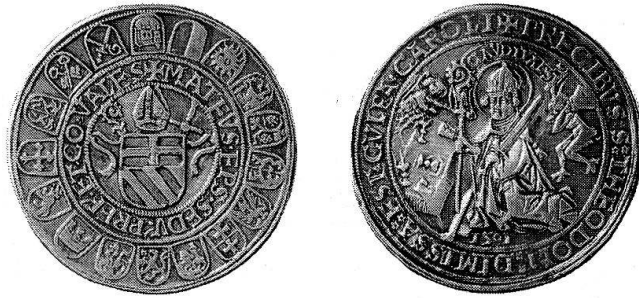
Doppelter Messtaler des Bischofs Matheus Schiner von Sitten, 1501 (verkleinert). Der heilige Theodul kniet am Altar mit Krummstab und Schwert, begleitet von Engel und Teufel.

geschwunden, seine Verehrung im 16. Jahrhundert zurückgegangen und wohl auch durch die kritische kirchengeschichtliche Richtung des Kardinals Baronius in Mitleidenschaft gezogen worden, der zu ähnlichen Wundergeschichten, wie sie von Theodul berichtet wurden, bemerkt: quae cum Magiam magis quam pietatem redoleant, merito rejicienda sunt . Der Kartäuser Heinrich Murer, der in seiner Helvetia sancta von 1648 ein gewaltiges Material zusammengetragen hat, unterdrückte deshalb die Legende Theoduls vom Flug auf dem Rücken des Teufels nach Rom und schrieb: «Deßwegen wollen wir diese Historiam (wann es eine Histori ist) weiters nicht einführen, sonder den guthertzigen Leser in Wallis schicken, dise ding zu erfahren.» Zur Zeit der beiden Schiner Bischöfe war die Kritik noch nicht laut geworden, und so begegnen wir dem heiligen Landesbischof auf zahlreichen Münzen des Bistums Sitten. Als aber die Zehnten die weltliche Gewalt des Bischofs energisch beschnitten hatten, da finden wir auch keinen Theodul mehr auf den Walliser Münzen. Dafür wurde nun augenscheinlich Maria vorgezogen, eine Entwicklung, die man in der Zeit der Gegenreformation verschiedentlich beobachten kann, es sei nur an die Patrona Bavariae , Bohemiae oder Hungariae erinnert.