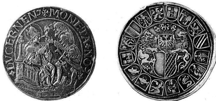
Taler der Stadt Luzern von 1518 (verkleinert). Blendung des heiligen Leodegar.