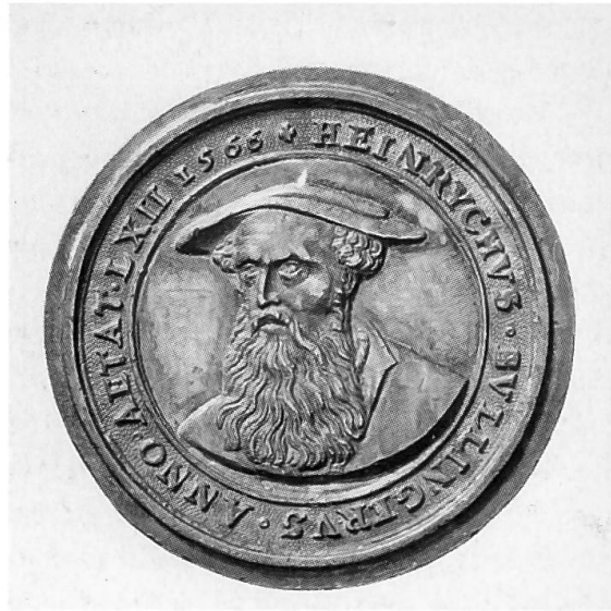
Abb. 12 und 13: Jakob Stampfer (1505/06–1579): Bildnismedaille von Bruder Klaus, um 1550/60, Silber vergoldet (Durchmesser 42,9 mm), und Bildnismedaille von Heinrich Bullinger, 1566, Silber (Durchmesser 41,5 mm: Schweizerisches Landesmuseum Zürich, LM IM 18 und LM AB 3464).

nicht die Rede, wohl aber von der Zerstörung bzw. Beschädigung anderer Zeugnisse der klösterlichen Adelsmemoria: angeblich 120 Totenschilder, die über den Adelsgräbern in der Klosterkirche hingen, wurden heruntergerissen und verbrannt, dazu in allen Gemälden das Wappen Österreichs in den «Switzer schilt» umgemalt. 88 Schliesslich sprach Ruprecht von der Zerstörung der Glasgemälde – die aber mit Blick auf den heute an der nördlichen Längsseite des Mittelschiffs vorhandenen Originalbestand aus der Zeit um 1305 nicht vollständig gewesen sein kann. 89