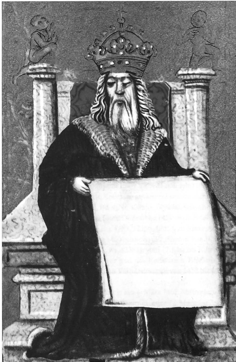
Abb. 34: Albrecht VI. als Herrscher und Gründer der Universität Freiburg; Darstellung im Statutenbuch des Collegium Sapientiae des Johannes Kerer, das um 1500 in Augsburg angefertigt wurde. Es orientiert sich an einer Darstellung Albrechts in seinem Gebetbuch, das noch zu seinen Lebzeiten angefertigt wurde. (Universitätsarchiv Freiburg im Breisgau A 105 / 8141, fol. 2 v)