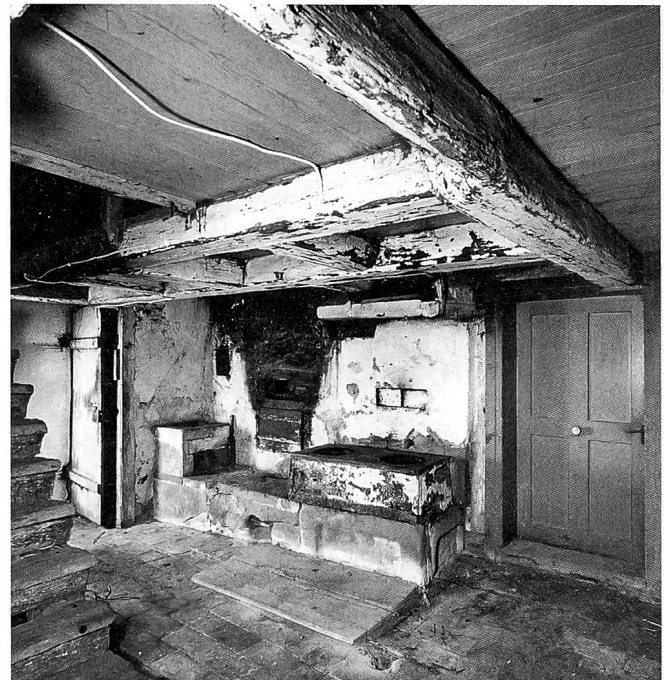
Das Gebäude aus dem 17. Jahrhundert wurde 1739 zu einem Doppelbauernhaus erweitert. Links und rechts der Eingangstüre gegen die Strasse liegen die beiden Stuben, darunter die je durch einen Abgang erschlossenen Keller. Gut erhalten ist die Küche mit offenem Rauchfang im westlichen Hausteil.