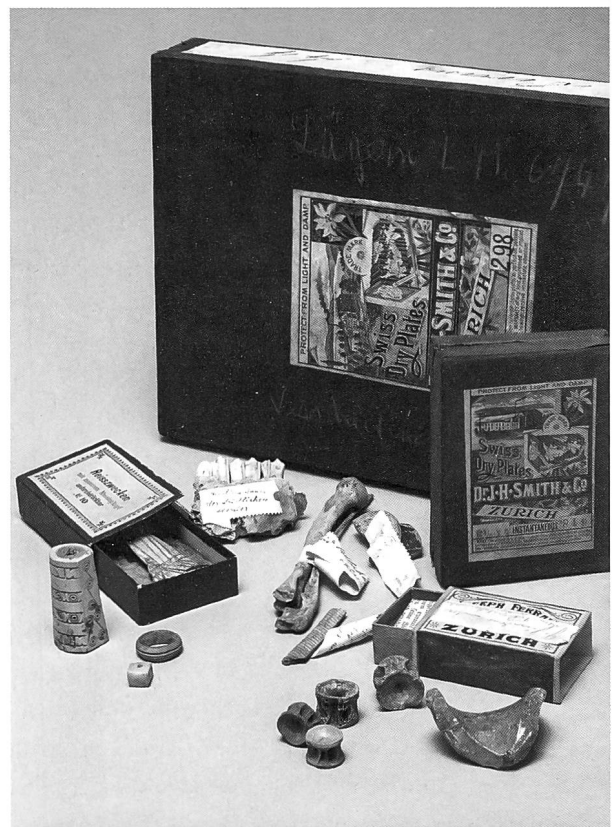
Funde der Ausgrabungen der Antiquarischen Gesellschaft in Zürich 1902/03: geschnitzte Beinobjekte, Knochen und Glasfragment.