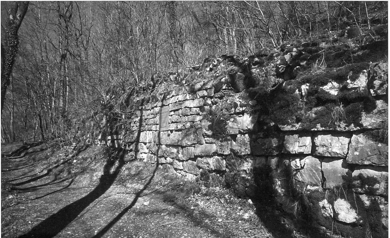
Von der Burg Alt-Lägern auf dem höchsten Punkt der Lägernkette sind nur noch geringe Mauerreste erhalten.