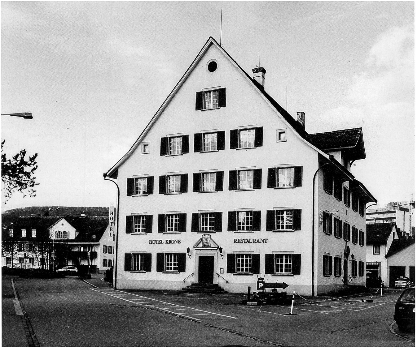
Der mächtige Bau der Taverne prägt bis heute das Stadtbild von Dietikon. Über dem Eingang des Neubaus von 1703 ist das Wappen des Bauherrn erkennbar, nämlich von Abt Franz Baumgartner und dem Kloster Wettingen.