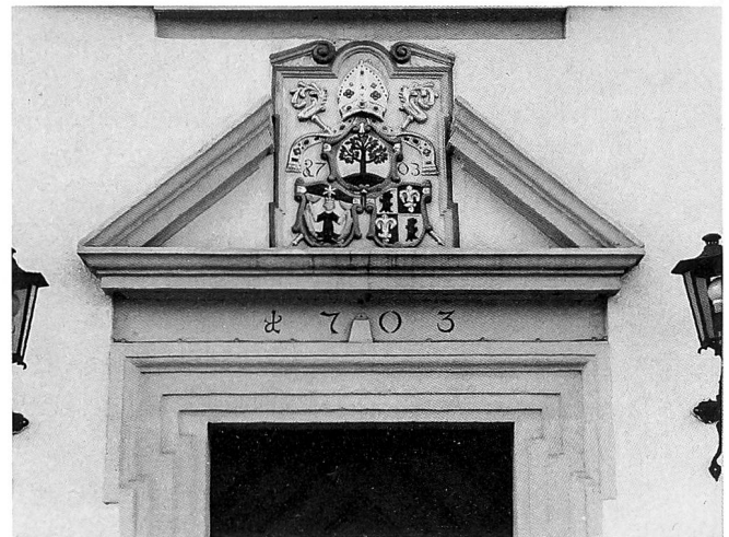
Der mächtige Bau der Taverne prägt bis heute das Stadtbild von Dietikon. Über dem Eingang des Neubaus von 1703 ist das Wappen des Bauherrn erkennbar, nämlich von Abt Franz Baumgartner und dem Kloster Wettingen.