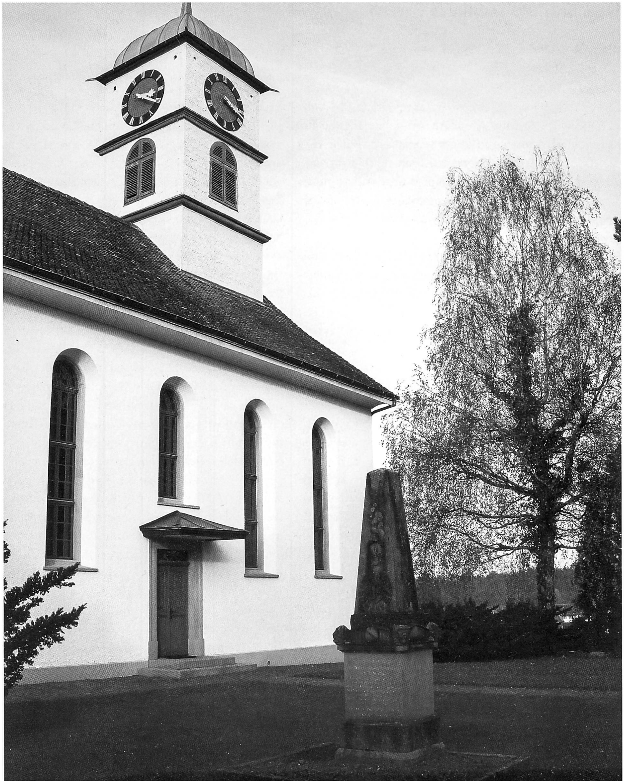
Blick auf das neben der Kirche Henggart liegende Grab- und Denkmal für Heinrich Frauenfelder mit dem sorgfältig gestalteten, reich verzierten Aufbau und einer gleichermassen zürcherischen wie eidgenössischen Ikonografie.