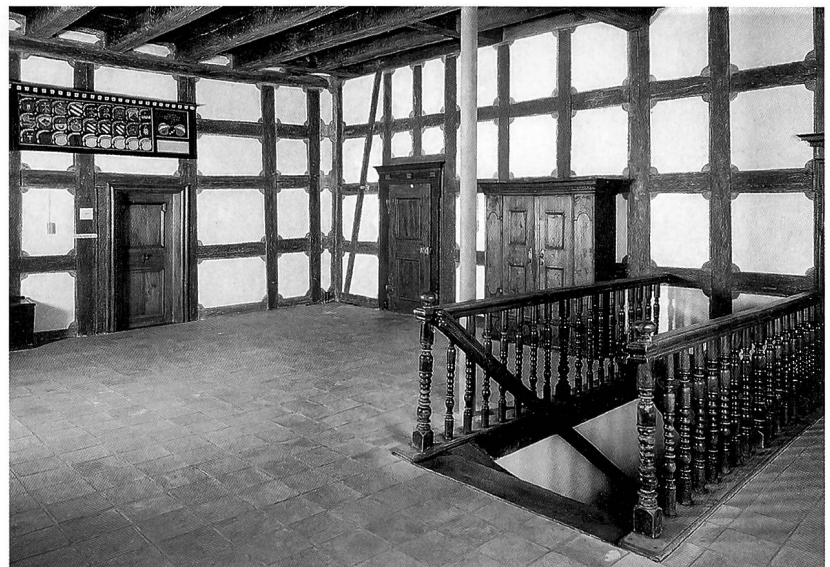
Das Amtshaus des Klosters Kappel, Aussenansicht, und Blick in die Halle im ersten Obergeschoss mit der Wappentafel der Amtsleute.