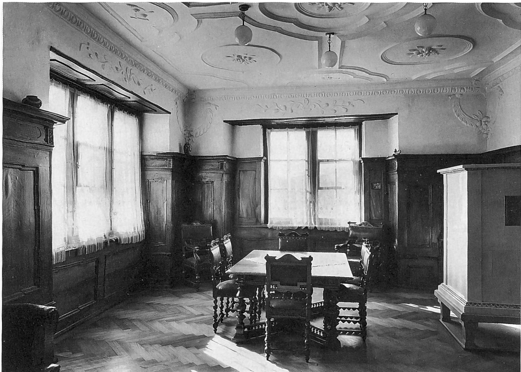
Das Schloss auf einer Ofenkachel im Landgut «Zur Schipf» in Herrliberg nach einer 1742 entstandenen Zeichnung von Hans Conrad Nözli. Saal in der Südostecke des Obergeschosses mit Stuckdecke und Wandtäfer aus der Bauzeit. Aufnahme 1945.