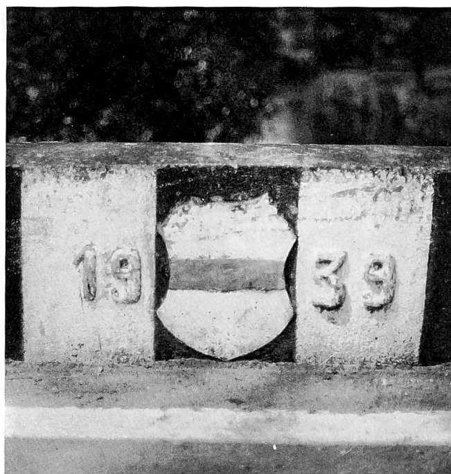
Lorzebrücke Bibelos von Südosten und Teil der Brüstung.