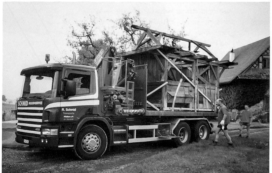
Fahrhabe auf Reisen: Der reastaurierte Schweinestall am neuen Standort 2001 und seine Versetzung im Jahr 2000.