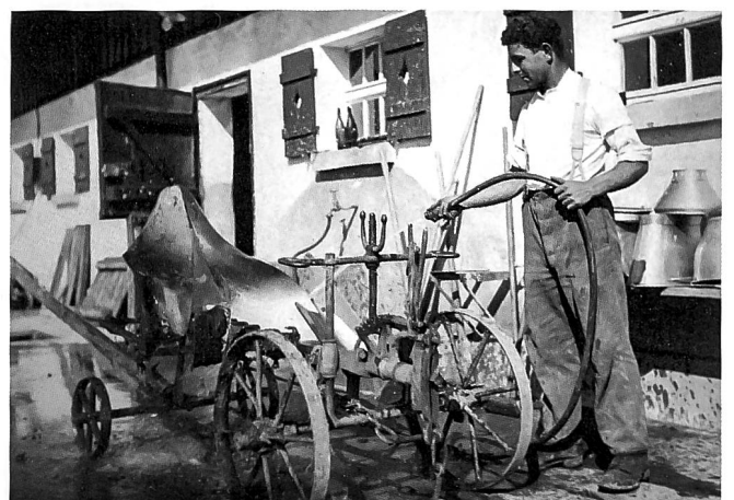
Der «Elektrohof» im Jahr 1924, Automobile vor dem Ökonomiegebäude, 1929, und Schnappschuss aus einem der Arbeitskurse in den 1930er-Jahren.