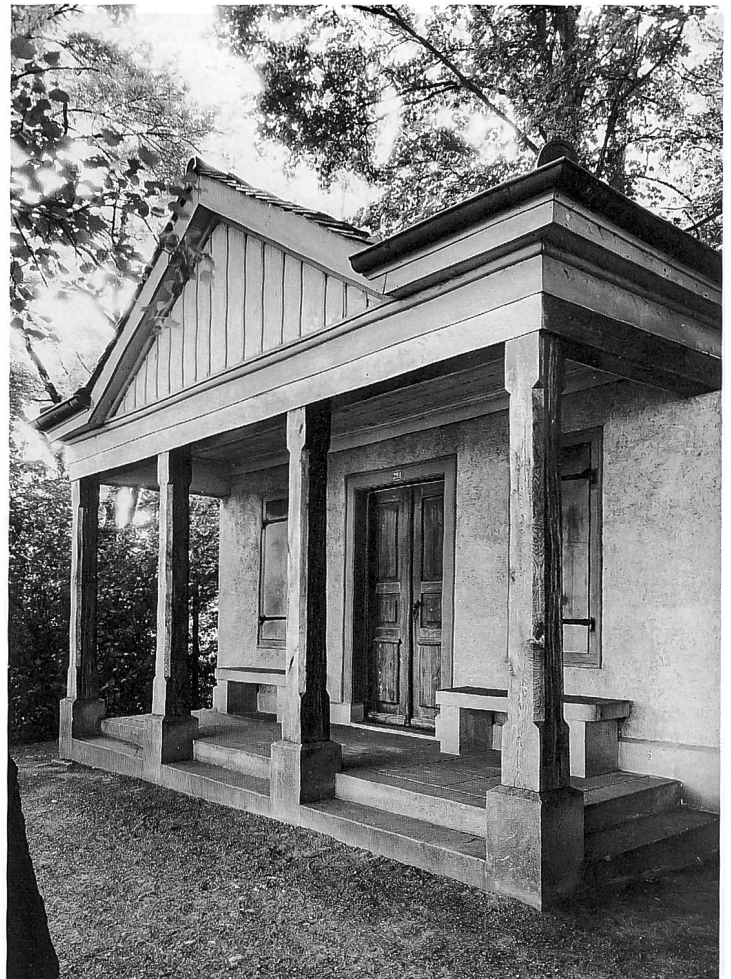
Das Lusthaus der «Gesellschaft zur frohen Aussicht» entstand 1842 als antiker Tempel und ging auf einen dörflichen Verein zurück, der Geselligkeit und Bildung verknüpfte. Die Holzpfiler waren ursprünglich rund. Der Pavillon befindet sich neben der Galluskapelle oberhalb des Dorfes und ist von einem kleinen Park umgeben, wie der Ausschnitt aus der Postkarte um 1900 zeigt.