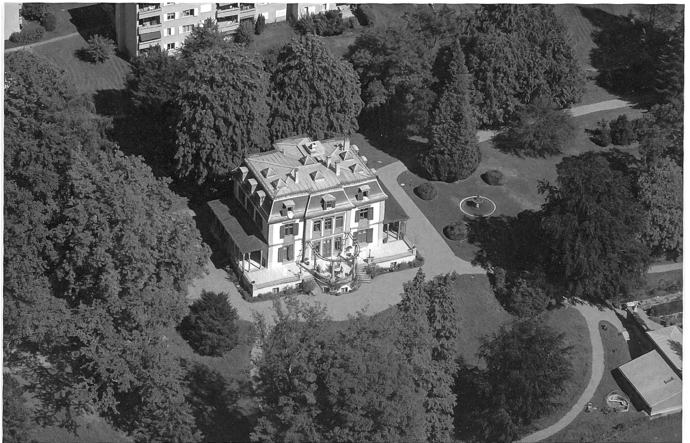
«Fabrique de soieries Stehli & Co», Gesamtansicht, und Unternehmervilla der Seidenfabrik.