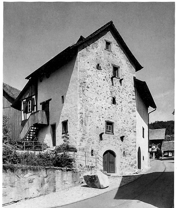
Der ehemalige Zehntenspeicher geht ins 16. Jahrhundert zurück; die beiden Ansichten zeigen den Zustand nach der Restaurierung in der Mitte der 1970er-Jahre. Durch die Lage an einem Hang und die verschiedenen Anbauten finden sich mehrere Eingänge, die auf unterschiedliche Nutzungen schliessen lassen.