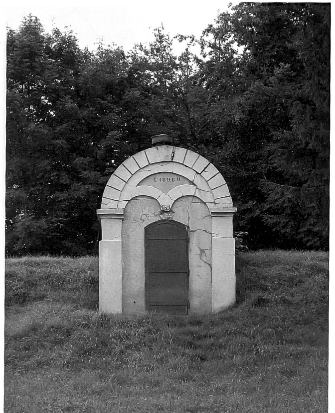
Das Reservoir und Schieberhaus Ossingen. Rück- und Vorderansicht. Aufnahmen 2005.