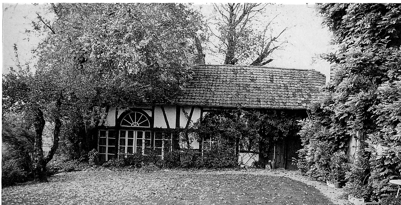
Das «Doktorhaus» in Rifferswil ist mit seinen Nebengebäuden bis heute ein gut erhaltenes, liebevoll gepflegtes Ensemble.