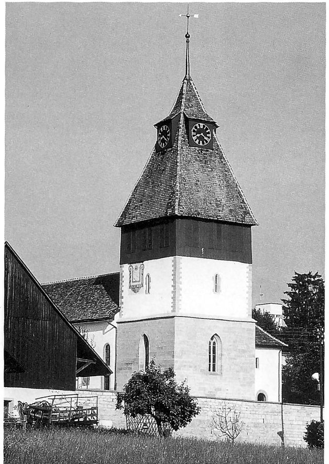
Blick in das Glockengeschoss mit der Mittelsäule von 1348 und Aussenansicht. Aufnahmen 2003.