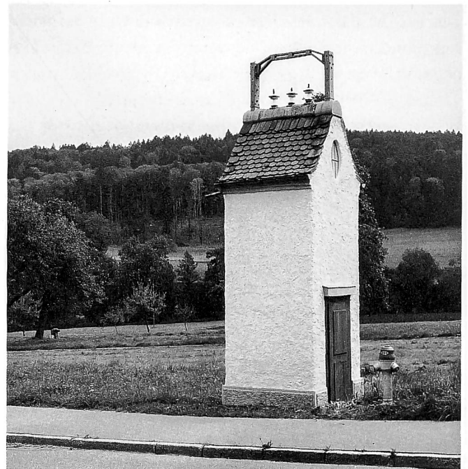
Die Transformatorstation in Madetswil geht auf einen Beschluss der Zivilgemeinde von 1913 zurück und entspricht dem Typ K, einem im Kanton Zürich eher seltenen Typ.