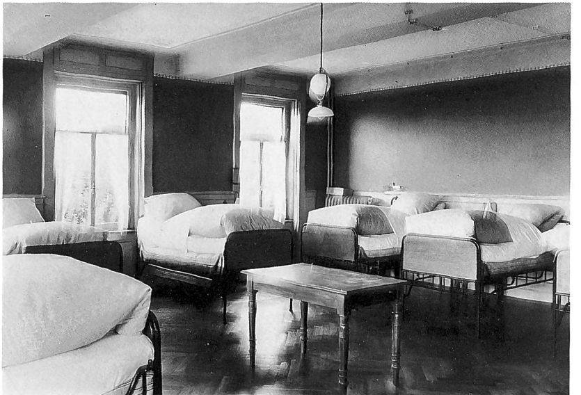
Pflegeheim Wäckerlingstiftung. Aussenansicht. Aufnahme 1972. Küche und Schlafsaal. Auf- nahme 1912.