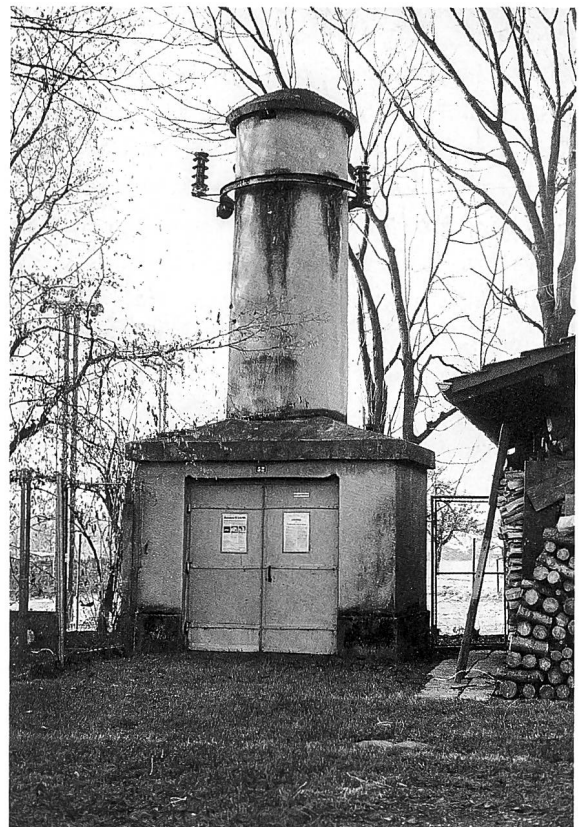
Die letzte im Kanton Zürich erhaltene Transformatorstation dieses Typs entstand um 1905 und war der Stolz der Färberei Jucker, wie der Briefkopf zeigt.