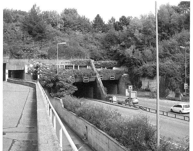
Der 1985 eröffnete Gubristtunnel ist das wichtigste und kostspieligste Bauwerk der Zürcher Nordumfahrung, die den Verkehr vom Limmat- ins Glatttal führt. Im Jahr 2000 wurde er im Schnitt täglich von 81'000 Fahrzeugen passiert.