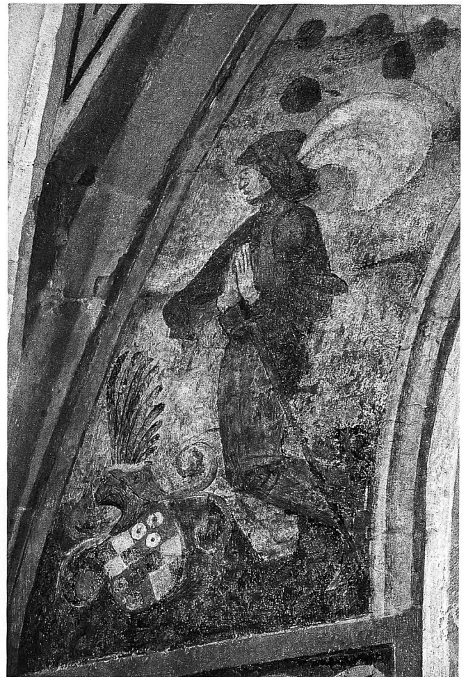
Blick in den Chor mit der Darstellung der Legende von der Auffindung des Heiligen Kreuzes. An der Südwand findet sich das Stifterporträt mit einem Adligen und dem Wappen der Familie von Hohenlandenbergl.