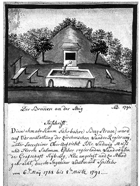
Eine Tuschzeichnung von 1794 zeigt den neuen Steigbrunnen mit seiner Inschrift. Hinter dem Brunnen ist der Geländeeinschnitt des alten Hohlwegs dargestellt. (Zentralbibliothek Zürich, Graphische Sammlung) Heute hat der Steigbrunnen seine Inschrift und die Radabweiser am Brunnenbecken verloren, sonst ist die Situation mit der historischen Darstellung vergleichbar. (Foto Andres Betschart)