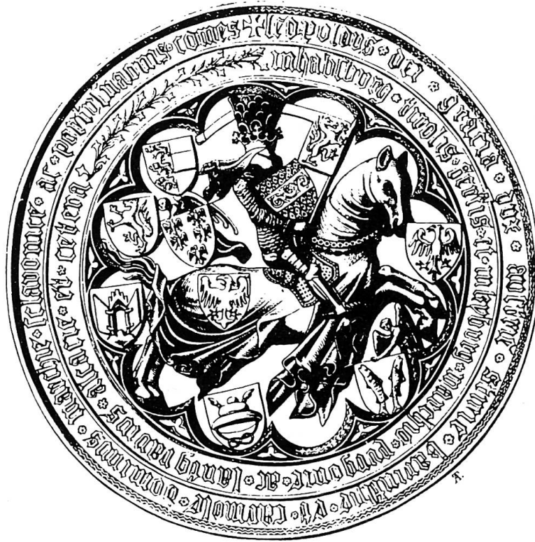
Reitersiegel von Herzog Leopold IV. von Österreich. (Umzeichnung aus: Karl von Sava: Die Siegel der österreichischen Regenten, 3. Abteilung, in: Mittheilungen der K. K. Central-Commission zur Erforschung und Erhaltung der Baudenkmale 12, 1867, Tafel X, Fig. 59)

welche Herrschaftsgebiete er im Rahmen der jeweils gültigen innerfamiliären Regelung zuständig war. 6