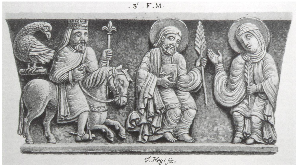
Abb. 4: Felix-und-Regula-Relief im Grossmünster. Aquatinta von Franz Hegi, um 1840, nach dem heute noch sichtbaren Relief am Kapitell eines Pfeilers im Kirchenschiff. Vgl. Abb. auf S. 19. (Gutscher, Grossmünster, S. 108)

Namenszusätzen gewissermassen die erste urkundlich fassbare Spur der besonderen Bedeutung Karls des Grossen für einen in Zürich beheimateten Priester.