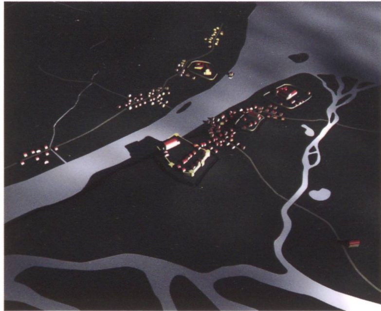
Abb. 1: Eine königliche Stadt am See. Zürich mit Pfalz, Fraumünster und Grossmünster um 890. (Oliver Lüde, Stadtarchäologie Zürich, 2004)

als dass es in Zürich liegt, dem Ort, wo sich auch deren Gebeine befinden. 17 Damit ist der Ort Zürich («Turegum») gemeint – «vicus» und gelegentlich «castrum» oder «castellum» genannt –, in dem diese verehrte Grabstätte zu finden ist. Entgegen der mit viel Aufwand propagierten gegenteiligen Meinung behauptet keine einzige dieser Quellen, das Fraumünster sei «über den Gräbern der heiligen Felix und Regula» errichtet worden. 18 Dass die unter den Äbtissinnen aus königlichem Geblüt gebaute Kirche, das «Frauen-Münster», spätestens bei seiner Weihe über einen Felix-und-Regula-Altar und folglich über Reliquien dieser Heiligen verfügt haben muss, versteht sich von selbst. Erwähnt allerdings wird ein solcher Altar erstmals 931. 19