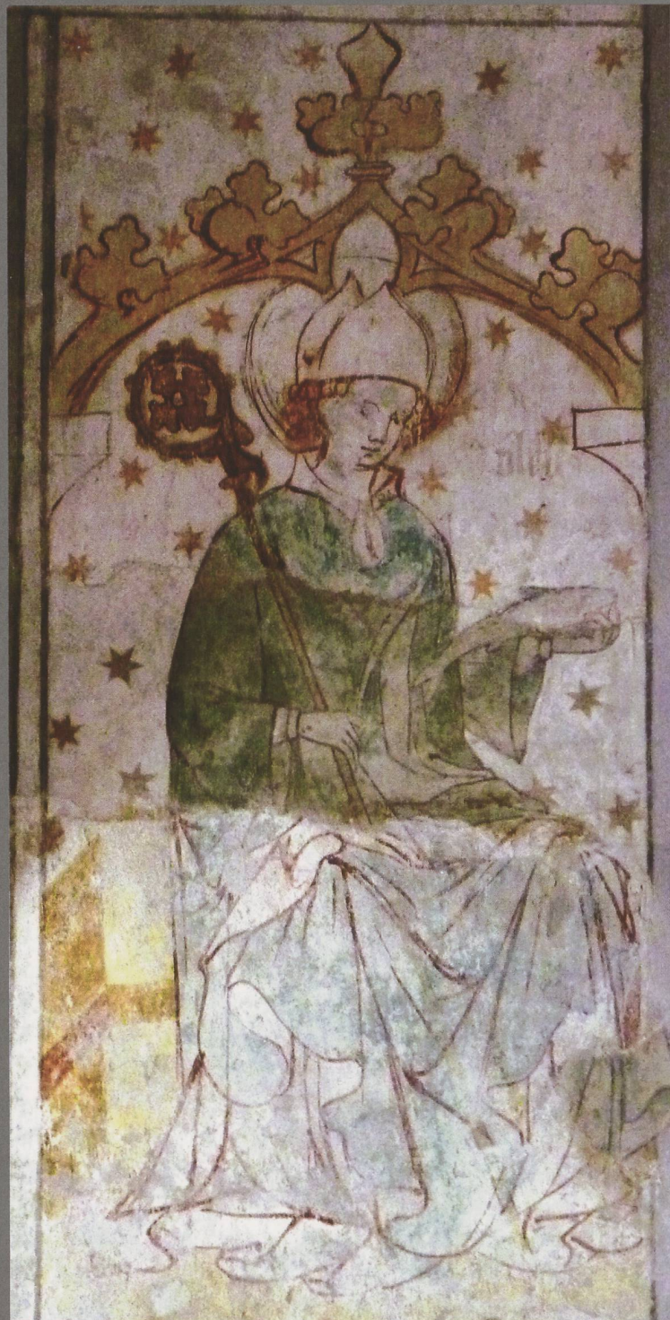
Der heilige Ulrich von Dillingen, Bischof von Augsburg 923–973 und «Ahnherr» der Kyburger. Darstellung im Chor der Schlosskapelle Kyburg, Mitte 15. Jahrhundert.