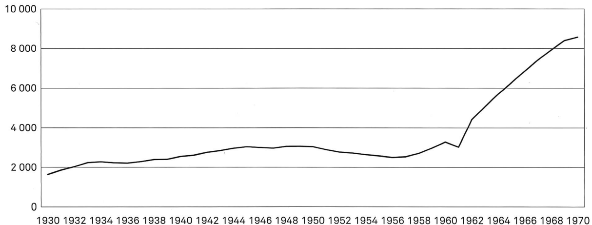
Grafik 1: Studierendenentwicklung, 1930–1970.

sehen glauben und zu begreifen suchen, so heisst das nichts anderes, als dass es letzten Endes um unser eigenes Selbstverständnis geht.» 2