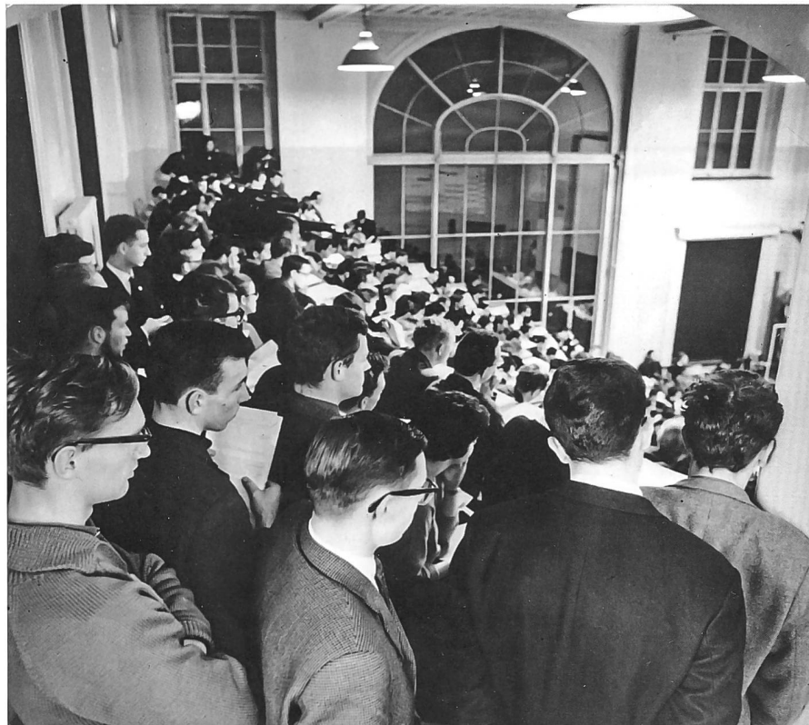
Abb. 1: Raumnot: Universitäten befinden sich in klassischen Bauten und gehören in die Stadt. Die markante Zunahme der Zahl der Studierenden vor und vor allem nach dem Zweiten Weltkrieg stellten diese Maximen auf die Probe. Studierende an der Universität Zürich, um 1960.

über 8000 Studierende. In den 1960er Jahren wurde an der Universität Zürich fast eine Verdreifachung der Zahl der Studierenden realisiert. 7