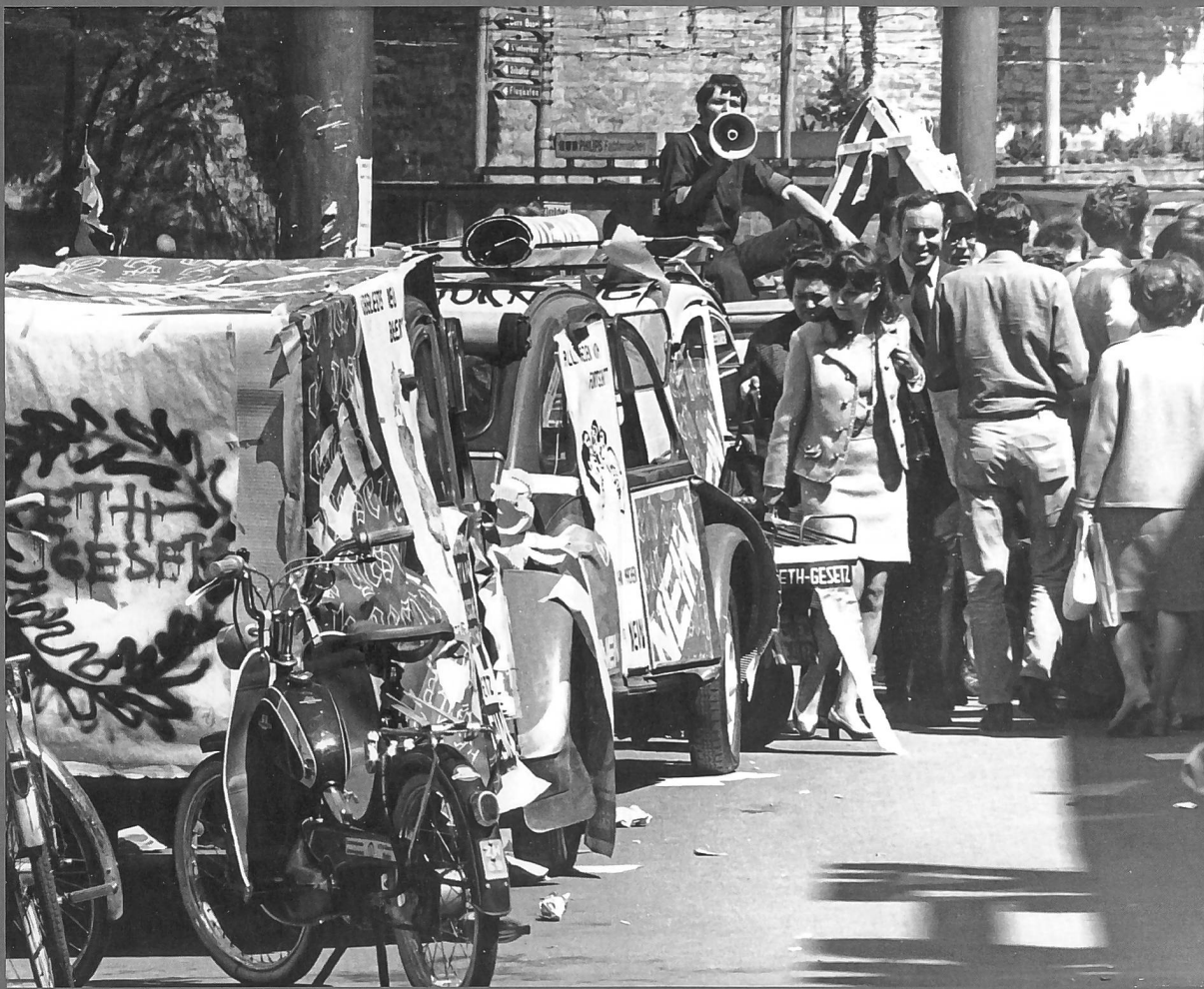
Abb. 1: Demonstration zum ETH-Referendum im Mai 1969, kurz vor der Volksabstimmung Anfang Juni, in der die Stimmbürger das ETH-Gesetz mit einer Nein-Mehrheit von 65,5 Prozent bodigten. Der Citroën 2CV («Döschwo») als Plakatträger vervollständigt das Zeitbild.