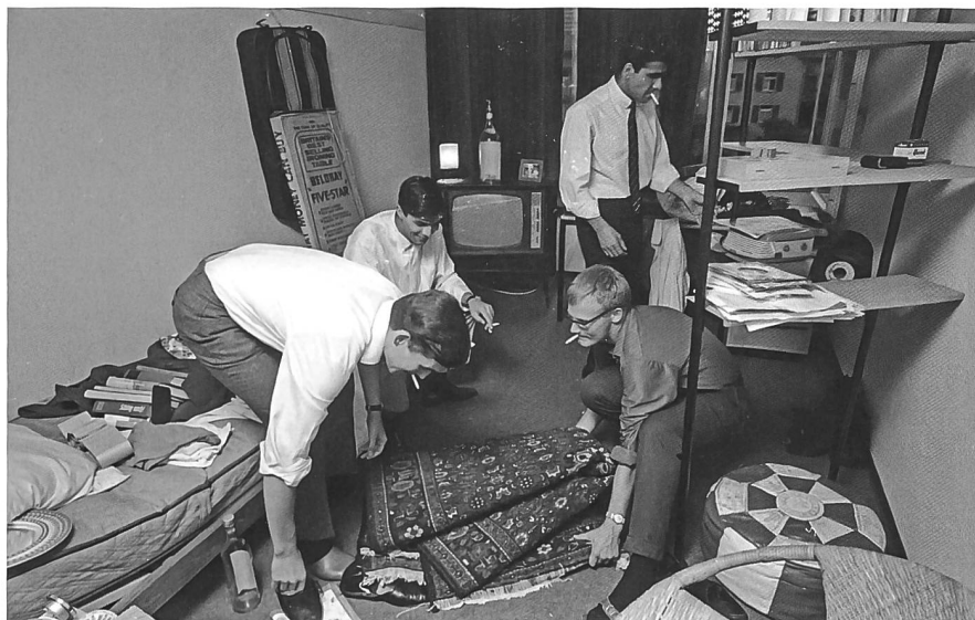
Abb. 4: Auch neue Wohnformen brachten die Studenten in den langen Sechzigern in Bewegung: Männer-WG im Studentenhaus der Studentischen Wohngenossenschaft Woko in Zürich Altstetten, Juli 1966.