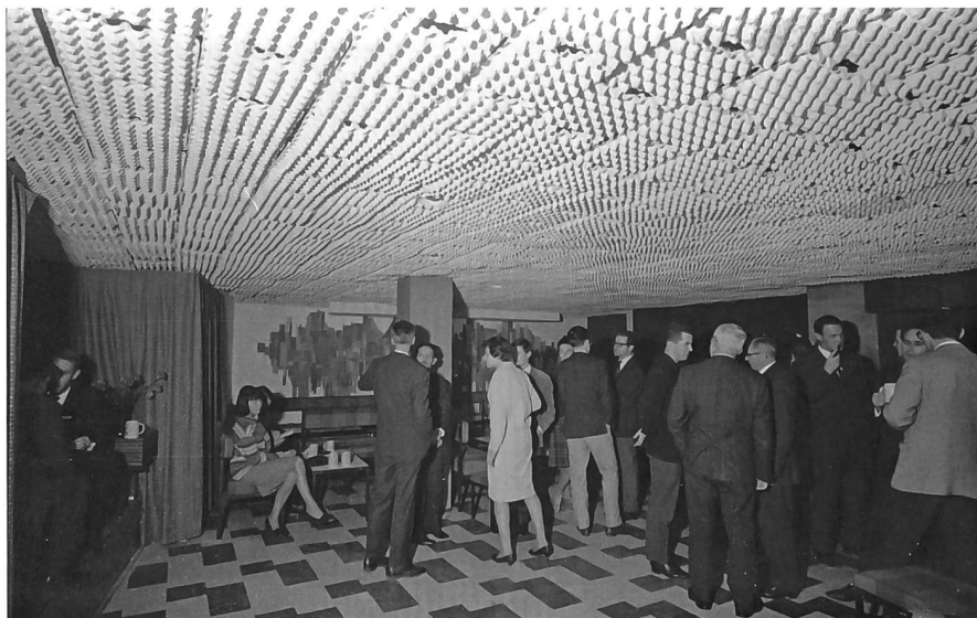
Abb. 3: Im akustisch gedämpften «Studentenkeller» trafen sich 1965 die Geschlechter und Generationen zum geselligen Austausch.