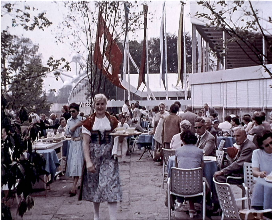
Abb. 2: Kellnerin in Tracht in Brüssel mit Landi-Stühlen: Schweizer Pavillon 1958 an der Weltausstellung in Brüssel in der ersten farbigen SFW-Ausgabe.