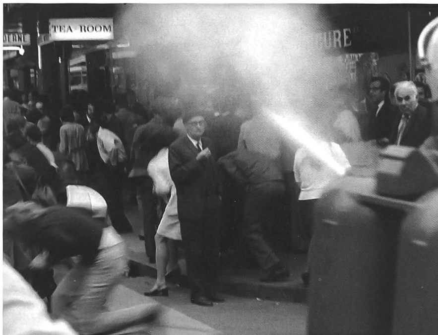
Abb. 6: Polizeieinsatz gegen Protest: Der Schah 1972 in Genf. SFW-Beitrag zum Staatsbesuch des Schahs von Persien Reza Pahlevi.

schiedeten internen Richtlinien. 21 Darunter wurden unterschiedliche Massnahmen verstanden, die vom Schnittrhythmus der Montage über eine Tonabmischung mit mehr Geräuschen und weniger klassischer Musik bis hin zur Erweiterung der Themenpalette reichte.