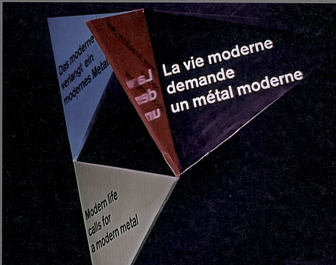
Abb. 1: La vie moderne: Schweizer Pavillon 1958 an der Weltausstellung in Brüssel in der ersten SFW- Ausgabe in Farbe.