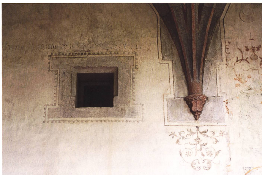
Abb. 4: Aufgemalte Ornamente akzentuieren die farbig gefassten Gewölberippen und das Läuterfenster an der Turmwand.

denn zu beiden Seiten und unter dem Tabernakel sind nur die Vorzeichnungen sichtbar, auch die Darstellungen in den nischenartigen Gehäusen sind nur als Vorzeichnungen oder als Aussparung zu erkennen. (Reformation in Dinhard 1524).»