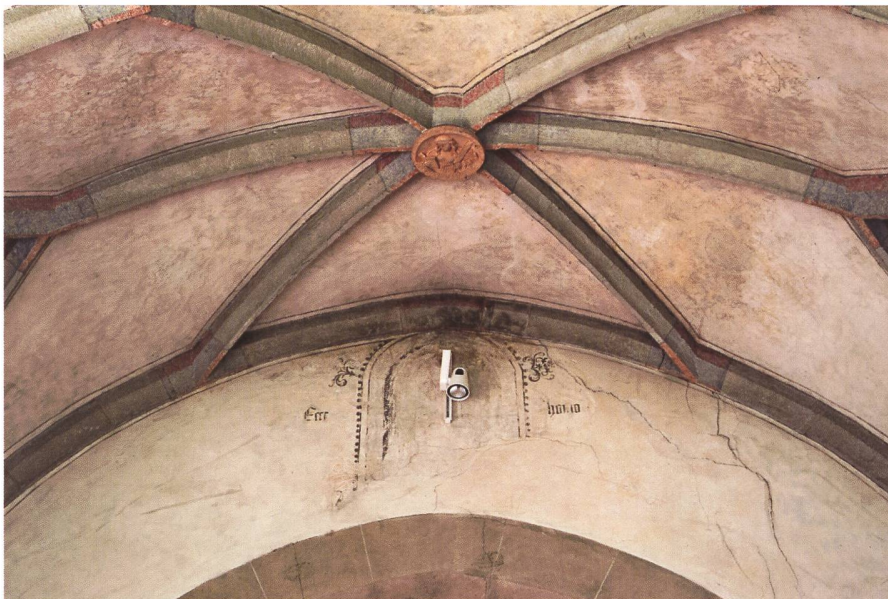
Abb. 5: Blick ins Gewölbe gegen den Chorbogen: Die farbig gefassten Rippen, der skulptierte Schlussstein mit der Darstellung der heiligen Petronella und die nur teilweise ausgeführten Malereien waren als gestalterische Einheit konzipiert.

mit Bleistift skizzierten Gestalten und Ornamente verschwanden für rund 450 Jahre unter weisser Tünche.» 7 Betont vorsichtig äusserte sich hingegen der Kunstdenkmäler-Inventarisator Hans Martin Gubler: Wände und Gewölbe seien für eine Gesamtausmalung vorbereitet, worden, «die aber – die Gründe sind nicht bekannt – unvollendet liegen gelassen wurde». 8