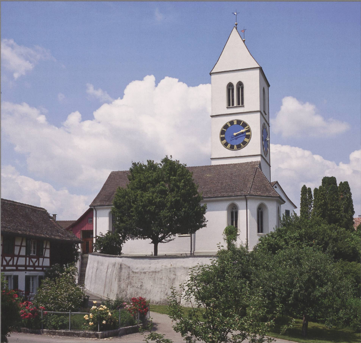
Abb. 1: Die leicht erhöht gelegene Kirche von Dinhard mit ihrem schlanken Turm wirkt noch heute beeindruckend.