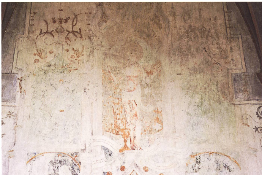
Abb. 3: Oberhalb der Tabernakelnische ist eine Konsole mit der Figur Christi gemalt. (Kantonale Denkmalpflege Zürich, Dübendorf)

Abb. 2: Eine illusionistische Scheinarchitekturmalerei verwandelt die in die Chornordwand eingelassene Tabernakelnische in ein raumhohes Sakramentshaus. (Kantonale Denkmalpflege Zürich, Dübendorf)