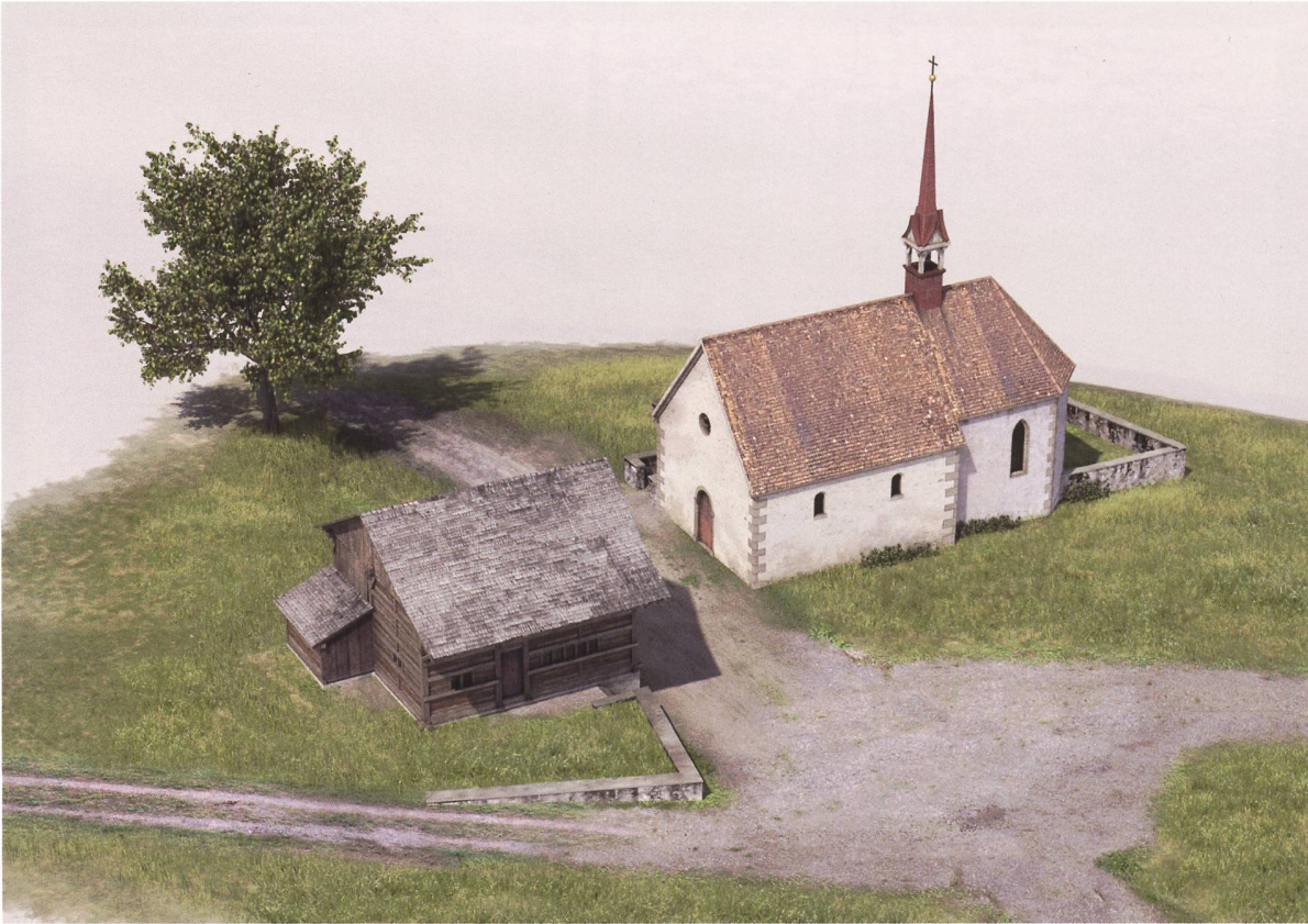
Abb. 6,7: St. Ägidius in Leimbach mit Haus des Kaplans, später Einsiedelei, Blick von Süden sowie mit der Ruine Manegg und Sihlübergang.

(Visualisierung Joe Rohrer, bildebene.ch, auf der Grundlage von Urs Jägglin, Amt für Städtebau)