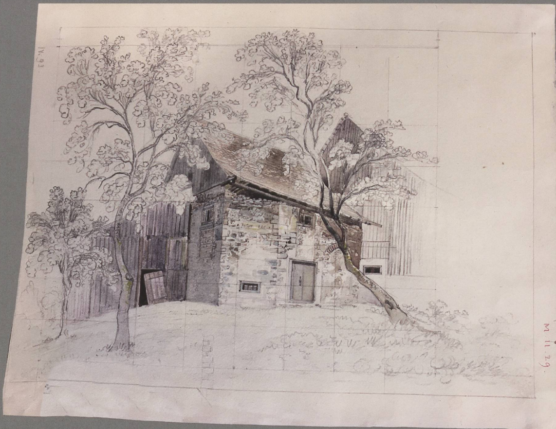
Abb. 1: Gebäudegruppe mit Resten der Ägidius-Kapelle in Unterleimbach. Zeichnung Ferdinand Keller. (Antiquari- sche Gesellschaft in Zürich / Staatsarchiv des Kantons Zürich)