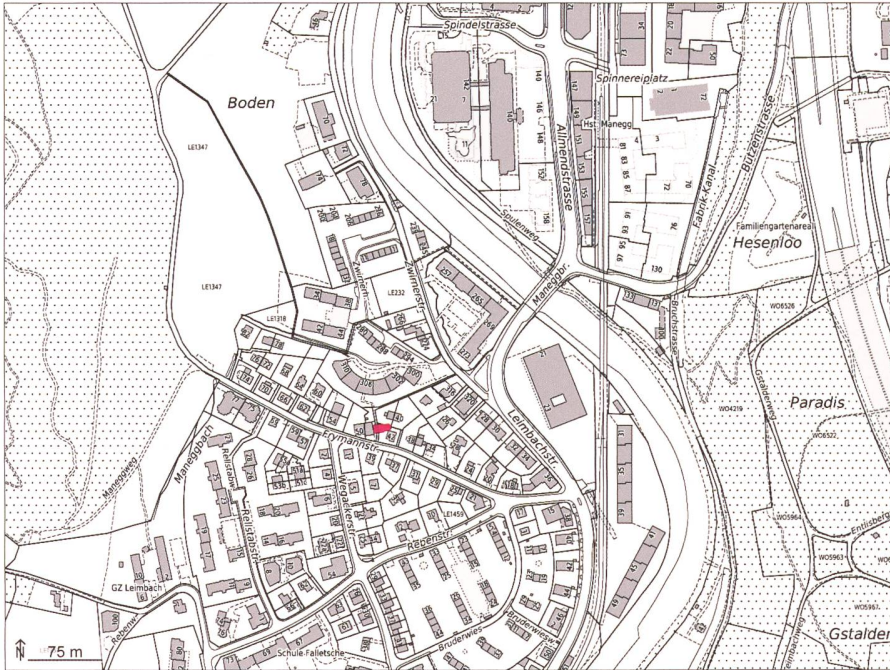
Abb. 4: Standort der ehemaligen Ägidius-Kapelle von Unterleimbach im heutigen Stadtplan. (Urs Jäggli, Amt für Städtebau)