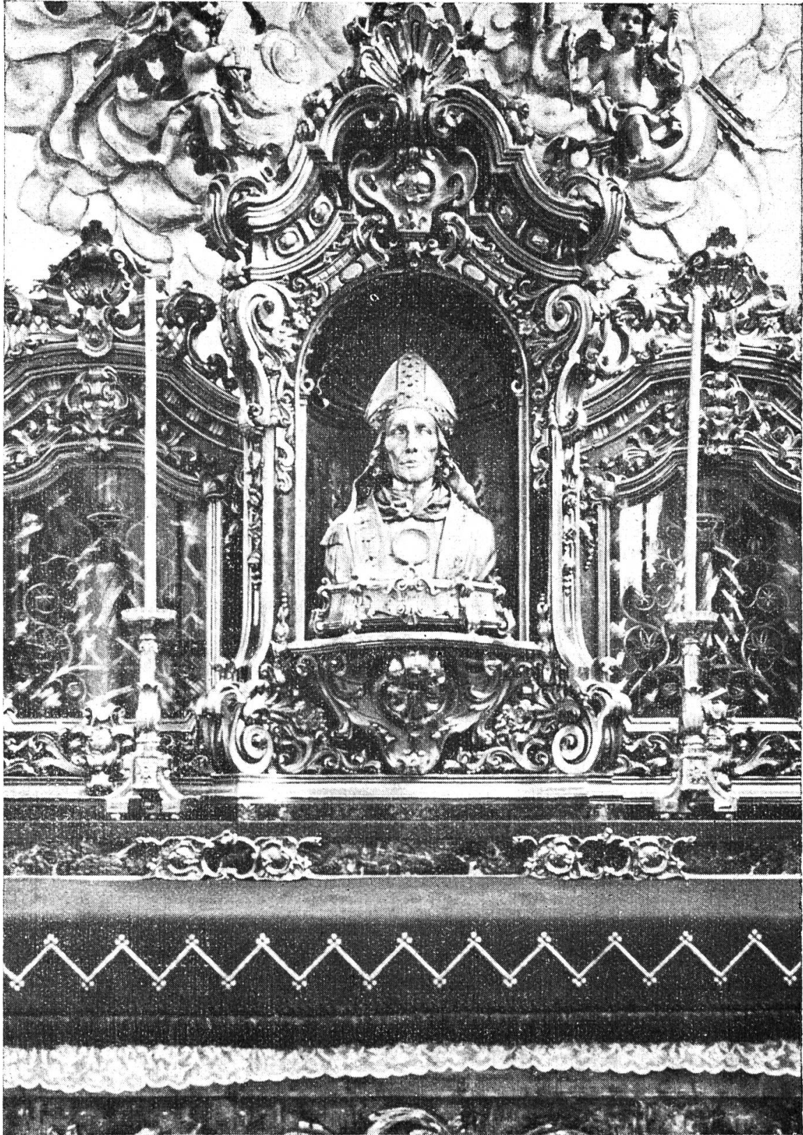
St. Pantalus-Altar in der Basilika zu Maria Stein