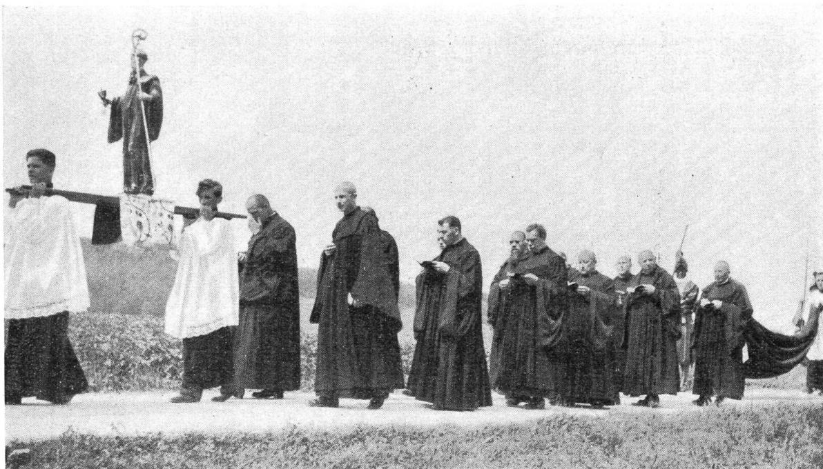
Der Convent von Mariastein auf der Prozession am Trostfeste 1932 voraus die Träger mit der St. Benedikts-Statue