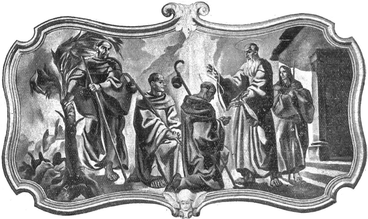
Sendung des hl. Maurus

deren jeder Religiose täglich bedurfte, nach dem Wortlaut der hl. Regel, noch beifügte.