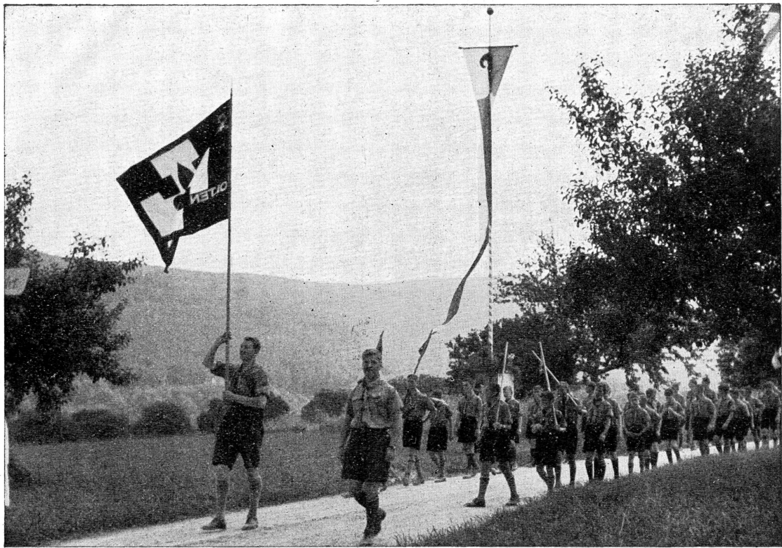
Pfadfindergruppen am Trostfest