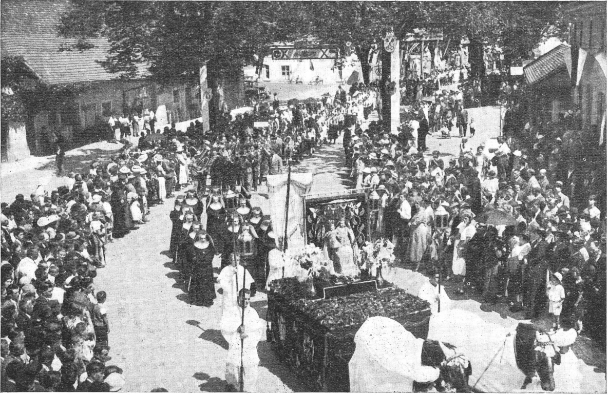
Das Gnadenbild in der Prozession