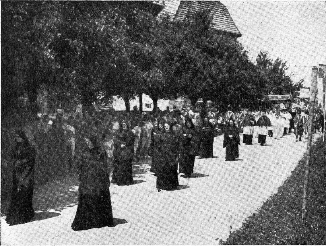
Bild vom Trostfest in Mariastein 1942