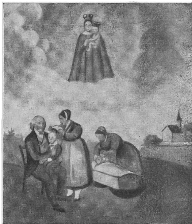
Abb. 8, links.