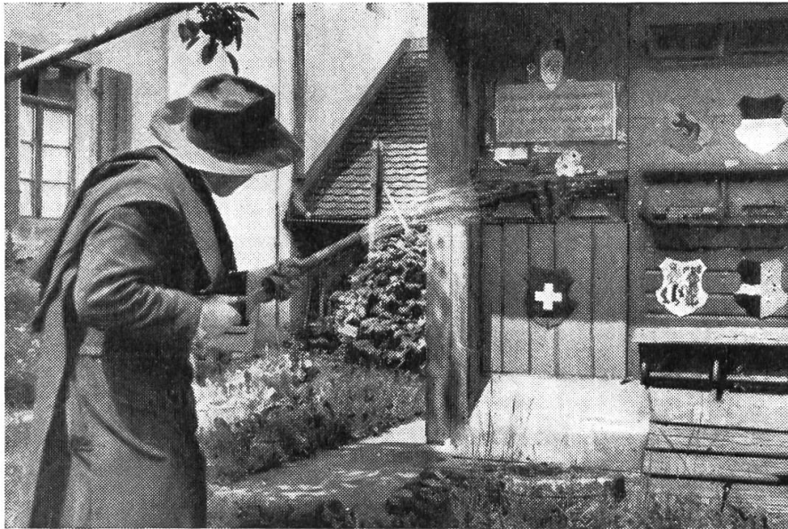
P. Pirmin im Abwehrkampf gegen Räuber

ten die Dinge trotzdem schief gehen sollten, flicht das Benediktuskreuz einen hilfreichen Bund mit den himmlischen Mächten. Wie in allen übrigen Sparten haben Sie auch in diesen drei Punkten den spottenden Mitbrüdern aus der Zunft des ungläubigen Thomas keinen Fuß breit nachgegeben. Bleiben Sie ruhig bei Ihrer Meinung. Wenn Sie lang genug warten, werden Sie wieder modern. Ihr Fußgängerideal jedenfalls ist bereits glänzend bestätigt worden. Denn kürzlich las ich in einer hochkultivierten Zeitschrift einen Artikel, der Ihnen Satz für Satz auf den Leib geschnitten ist. Da heißt es, man sollte heute nicht mehr von Fort-Schritt, sondern von Fort-Sitz sprechen, nicht Wander-