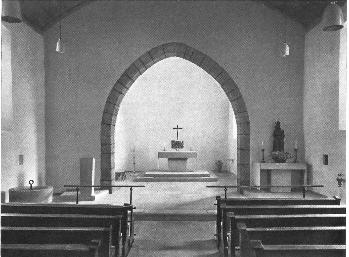
Gesamtansicht des Chorraumes mit Marienaltar, Ambo und Taufstein St.-Martins-Kirche Pfeffingen/BL