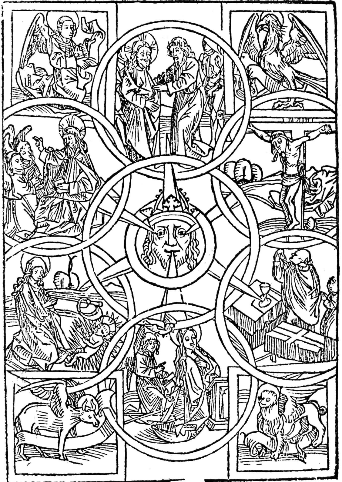
Visionsbild in der Pfarrkirche Sachseln