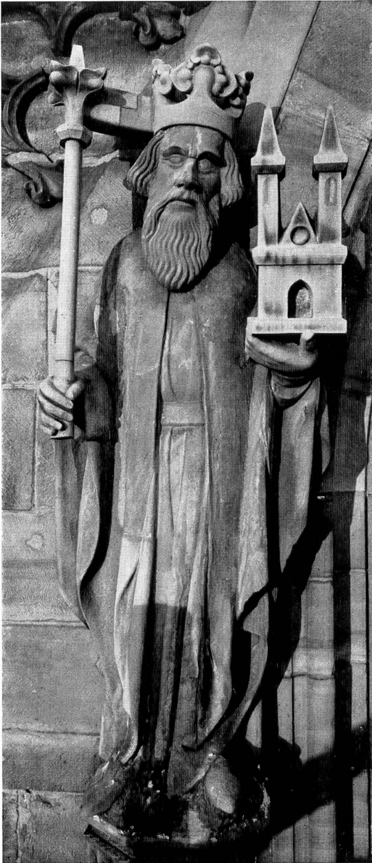
St. Heinrich, Donator des Basler Münsters