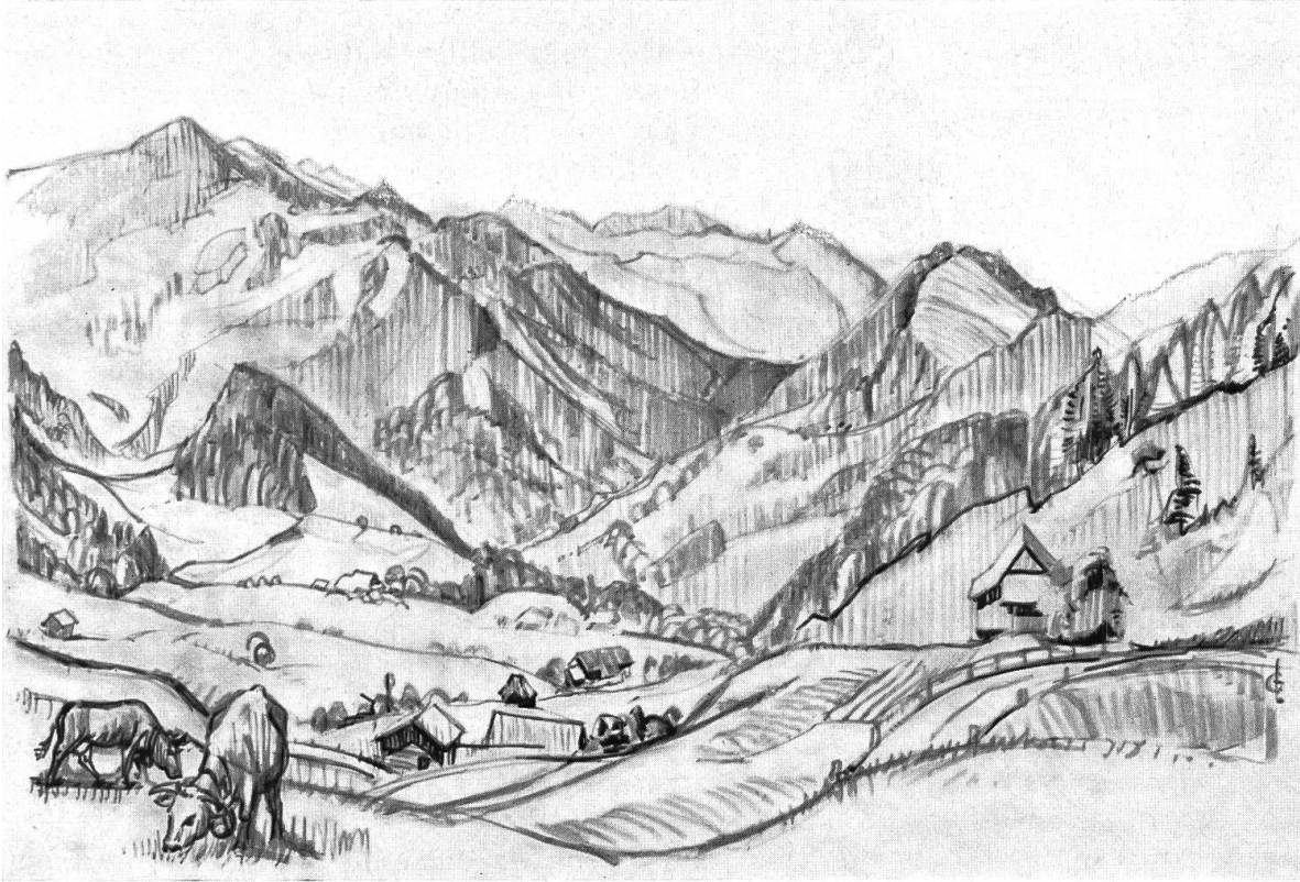
Blick von der Strasse nördlich des Passwangs auf das gebirgige, landschaftlich schöne Beinwilertal.

Musse der beschaulichen Maria zu unterbrechen. Er wird damit als ein homo contemplativus gekennzeichnet. Beinwil bot den idealen Rahmen dazu.