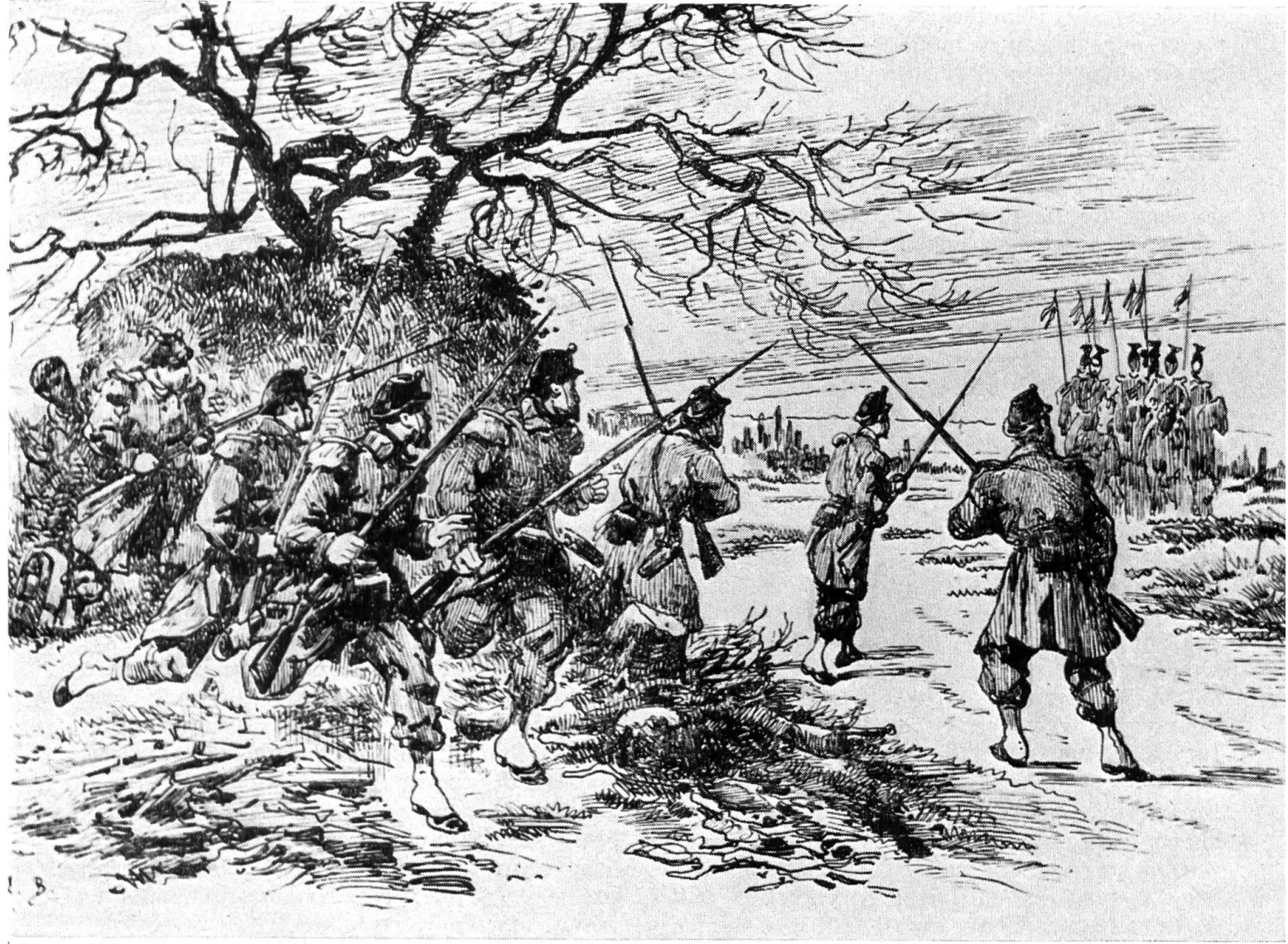
Les Uhlans, Les Uhlans