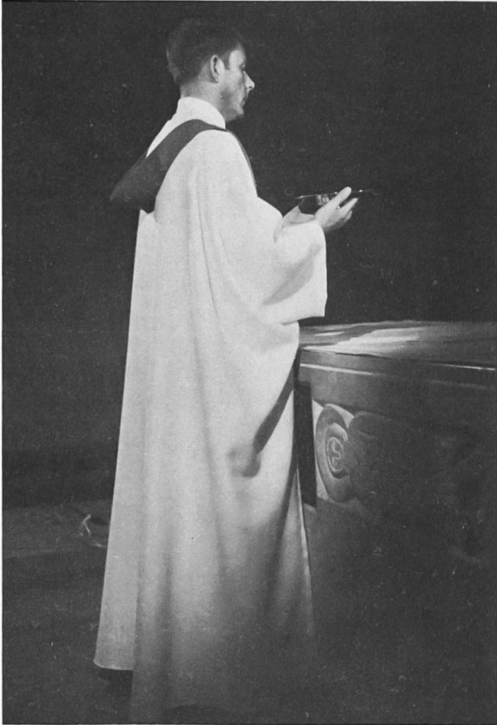
Liturgischer Mantel (Priester) von der Seite. Atelier Rosa Schmid

Bedeutung, was für ein Material man für diese vereinfachten Kultgewänder wählt. Niemals dürfen sie billig oder flatterhaft wirken. Wie die früheren, reichen Kaseln werden sie heute ebenso liebevoll und mit Sachkenntnis gestaltet. Leider sind die Paramentenvereine fast überall eingegangen. Dem müssen wir Rechnung tragen, Formen und Strukturen der gegebenen Situation anpassen.