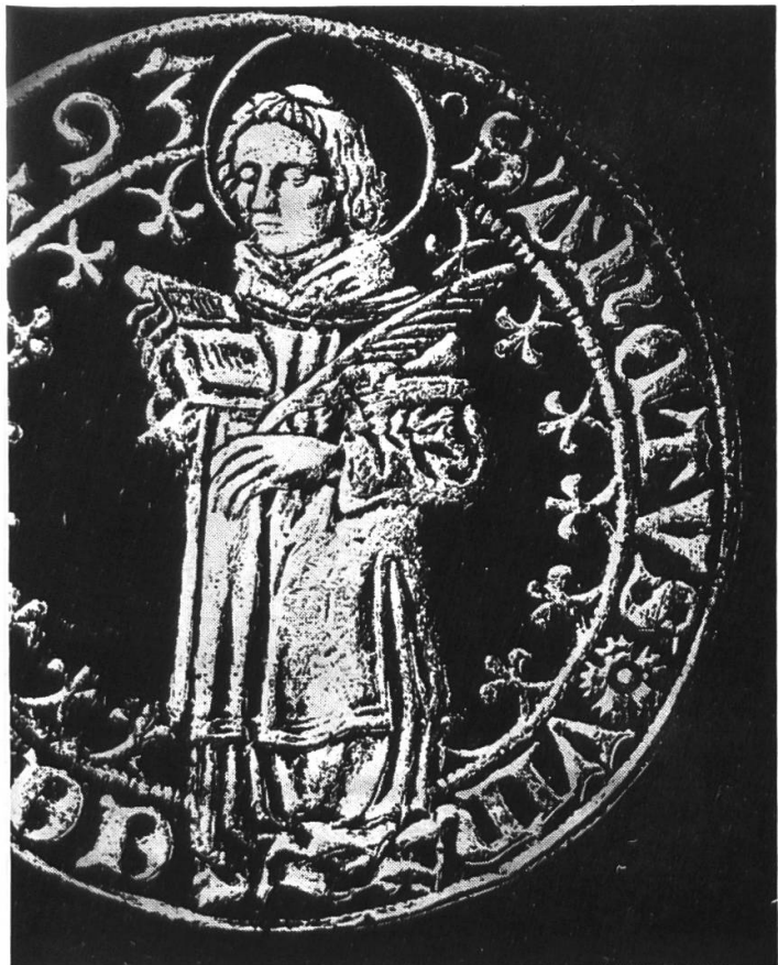
Vinzenz von Saragossa