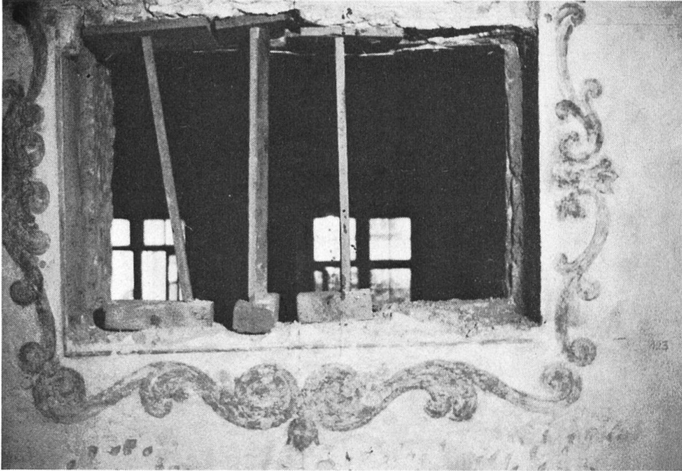
Querlüftungsfenster des Refektoriums. Gangseits waren die Fensteröffnungen ebenfalls mit grünen Rankeneinfassungen versehen.