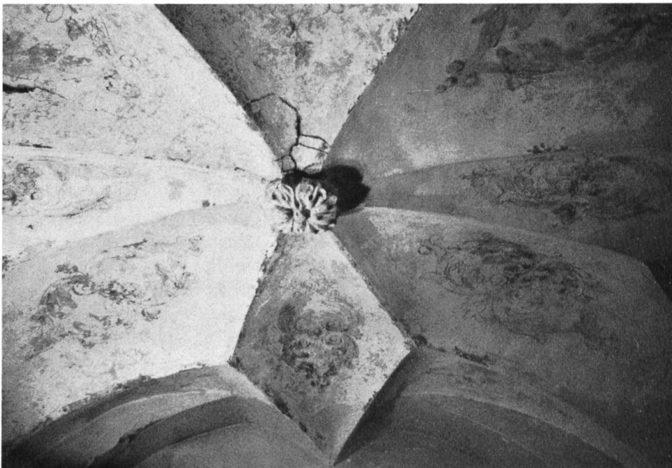
Konventstock, Erdgeschoss. Ein sehr schwieriges und nervenkostendes Unterfangen war das Hervorholen und Reinigen des Sternengewölbes an der Nordseite des Ganges.