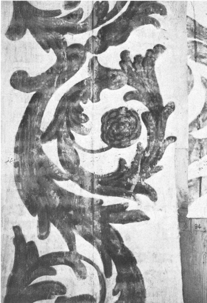
Gereinigte und ausgefasste Tafel.

friesbemalung der Rippen war wie die Rautenfüllungen von sehr schlechter Haftung.