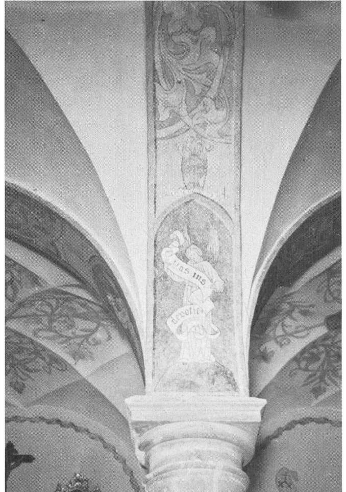
Sakristei. Gurtenbogen, Detail. In der Spitzbogenfüllung hält der Engel ein Schriftband mit Anrufungen aus der lauretanischen Litanei. Text: Du vortreffliches Gefäß der Andacht. Symbol: rauchendes Weihrauchfass.

Zwischen 1850 und 1890 (maltechnisch gesehen) wurde die heute sichtbare neugotische Ölmalerei auf Kalkuntergrund ausgeführt. Später, zuletzt 1934, wurde der ganze Raum wieder mit Ölfarbe überstrichen, um die Schadstellen zu überdecken. Damit wurde die Malerei wieder mindestens zweimal überstrichen. Mit Schiefermehlpachtel wurde geflickt oder gespachtelt.