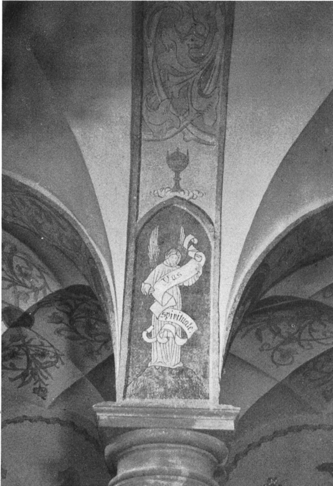
Sakristei. Gurtbogen, Detail. Text: Du geistliches Gefäss. Symbol: Kelch.

Diese Milieumalereien wurden erst bemerkt, als man die teilweise bis zum Grund abblätternden Farbschichten ablaugen musste. Die Loslösung der obersten Ölfarbanstriche von den bemalten Flächen war schwierig, da die Bemalung auch in Ölfarbertechnik ausgeführt war. Es war unvermeidlich, dass dabei auch einiges verloren ging. Durch farbliche und formale Wiederholungen der Ornamente liessen sie sich aber retuschieren oder ergänzen. Andere Verluste entstanden durch Verlegen von elektrischen Leitungen. Formwiederholungen wurden mit Pausen rekonstruiert und ergänzt. Bei den zwei Fenstern und bei der alten Türnische zur Benediktuskapelle kamen bei den Freilegungsarbeiten rote Sandsteinimitationen mit schwarz gemalten einfachen Fugen hervor.